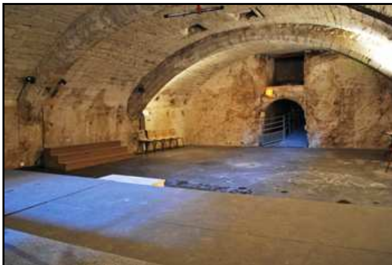
La cave du Pape, La Chartreuse, à Villeneuve les Avignon, photographie tirée du site de La Chartreuse.