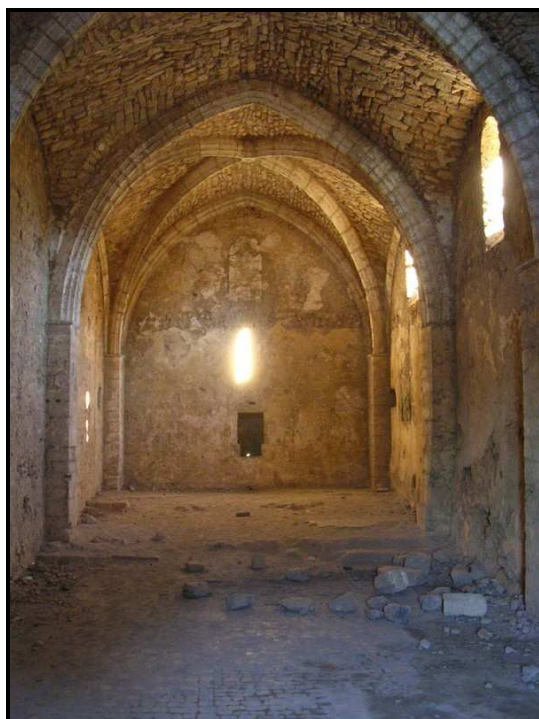
La chapelle d'Aumelas (Hérault), photographie de Damien Pobel.