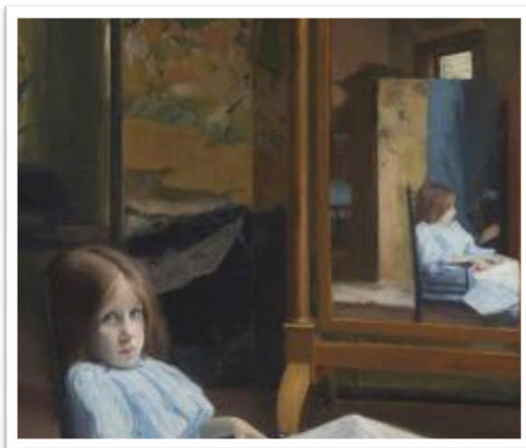
Jeune fille devant la psyché, J.-E. Blanche, 1889

Spectacle pour enfants à partir de 8/10 ans