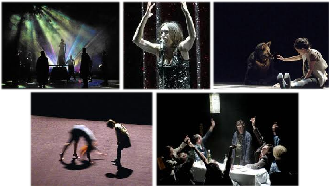
Quelques spectacles créés par Joël Pommerat- Photos de scène E. Carecchio