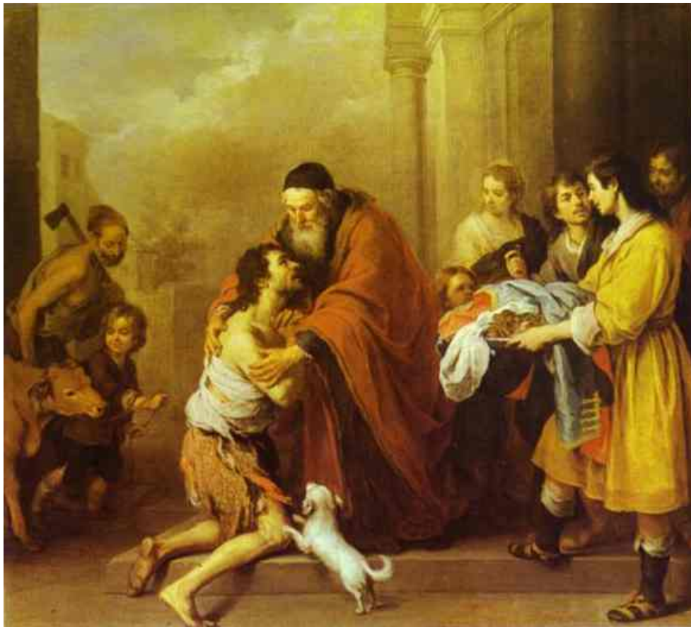
Document 1 – Bartolomeo Esteban Murillo, Le retour du fils prodigue , 1670-74, huile sur toile, 105 x 135 cm, , The National Gallery of Art, Washington, Etats-Unis.