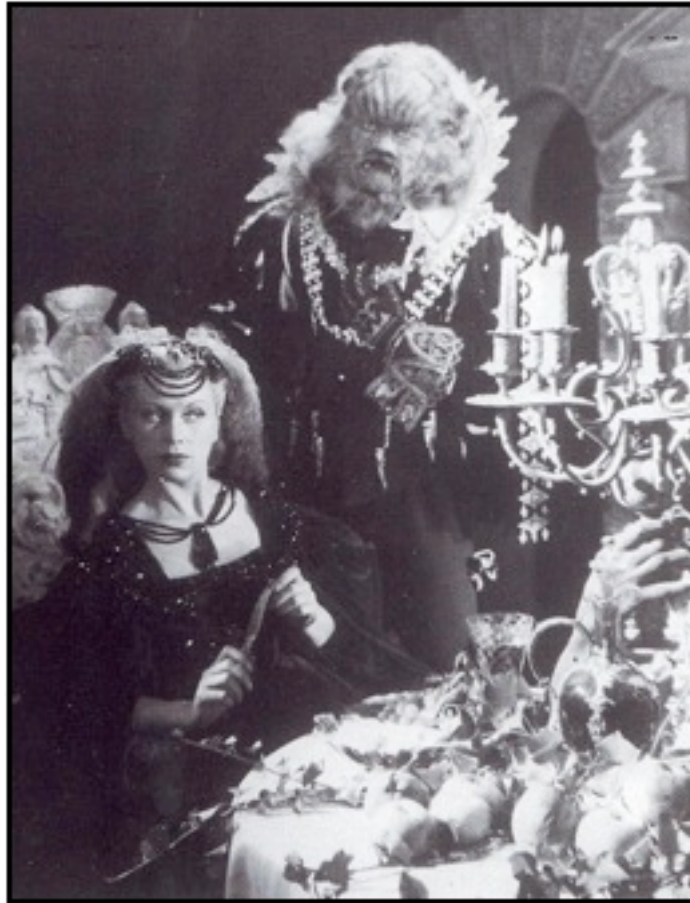
Document 3 - La belle et la bête , photogramme du film réalisé par Jean Cocteau, 1946.