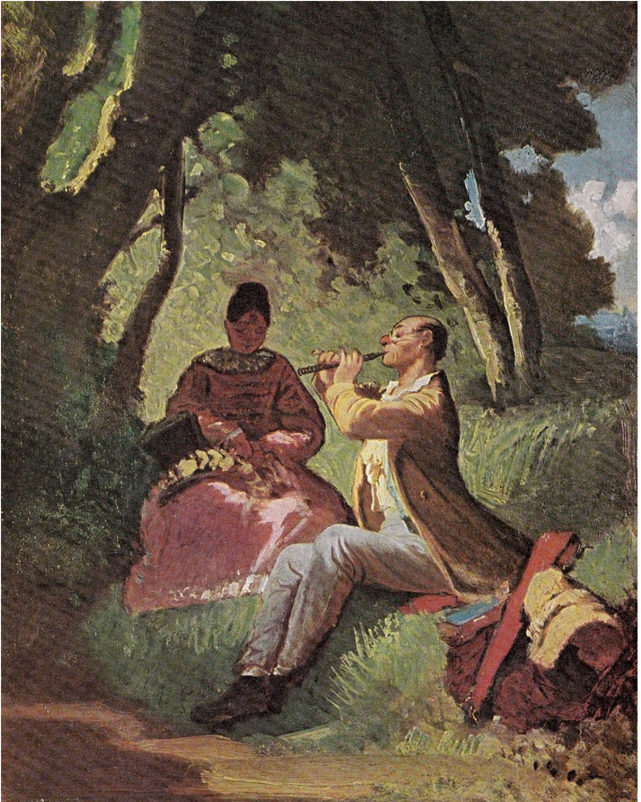
Document 3 : Carl Spitzweg, Das Flötenkonzert 1860 huile sur toile 37,5 30 page 91 Carl Spitzwegs Manuel Albrecht Schuler 1980 Stuttgart