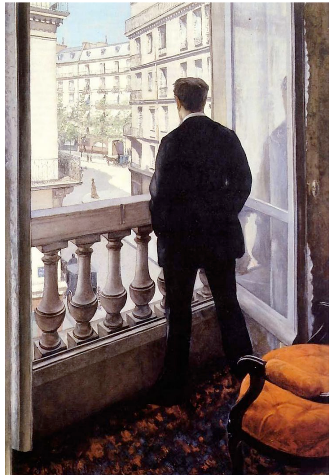
Document 5 : Caillebotte, Jeune homme à sa fenêtre ,