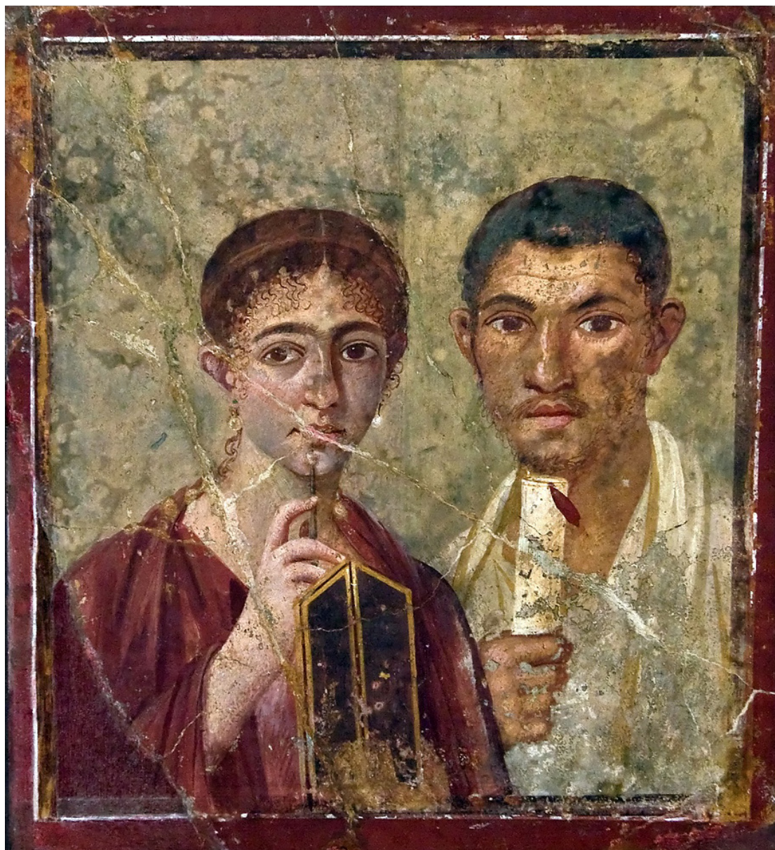
Portrait de Paquius Proculus et son épouse, fresque murale de la casa di Pansa, Pompéi, I er siècle