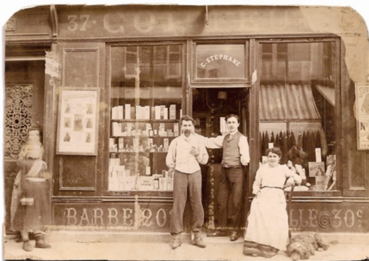
le salon de Grand-Bisbille