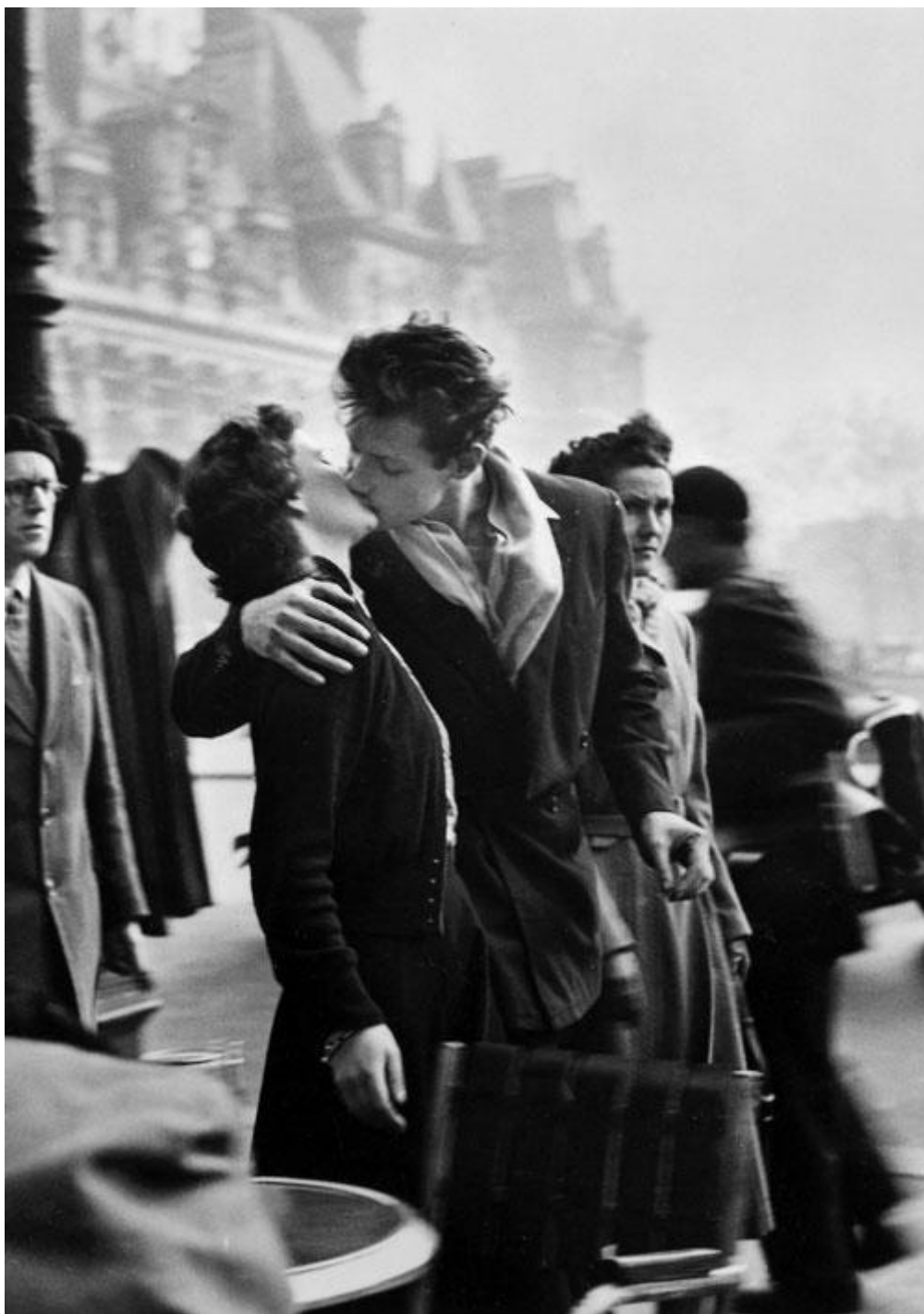
Robert Doisneau, Le Baiser de l'Hôtel de Ville . Photographie, 1950.