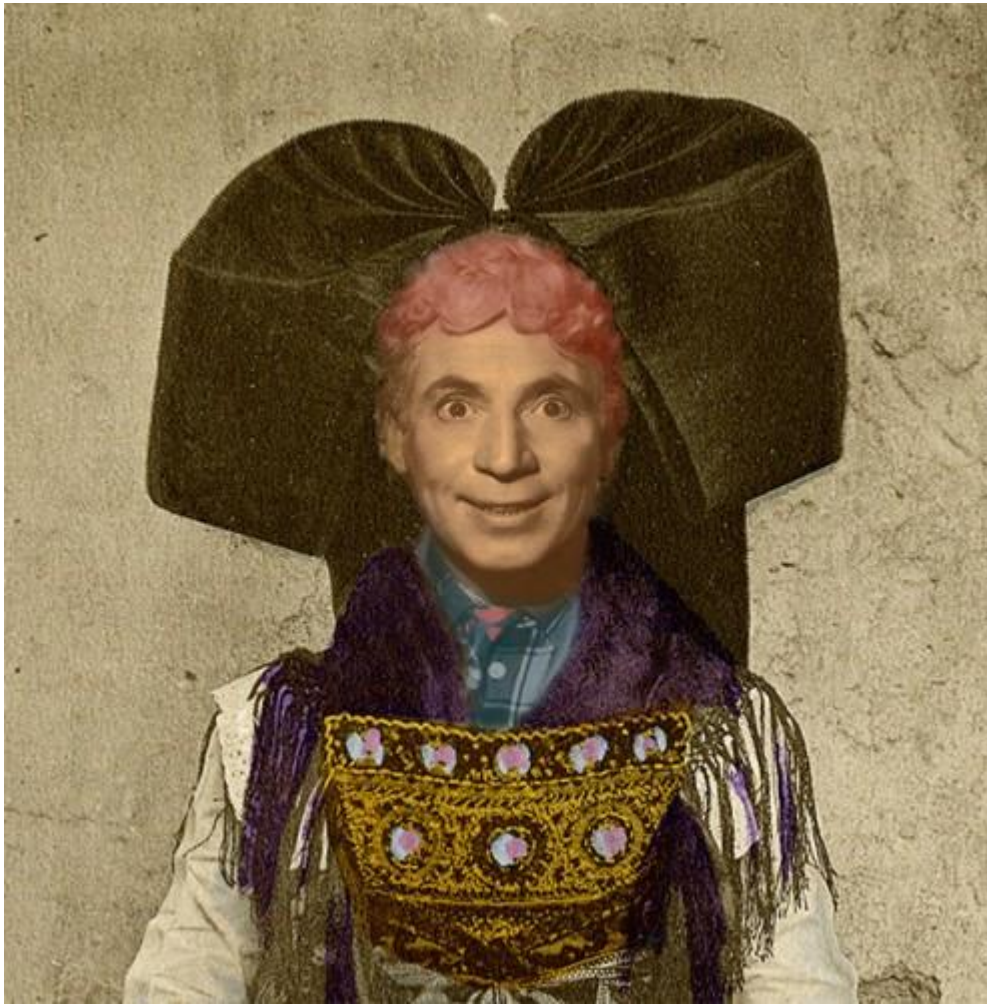
Visuel pour le spectacle Il peint si bien la vieille tante à verrues, que chacun l'a vite reconnue , par la compagnie Arsène au théâtre L'Échangeur à Bagnolet. Auteur : Michel Jacquelin.