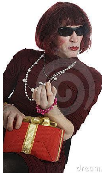
Homme déguisé en femme