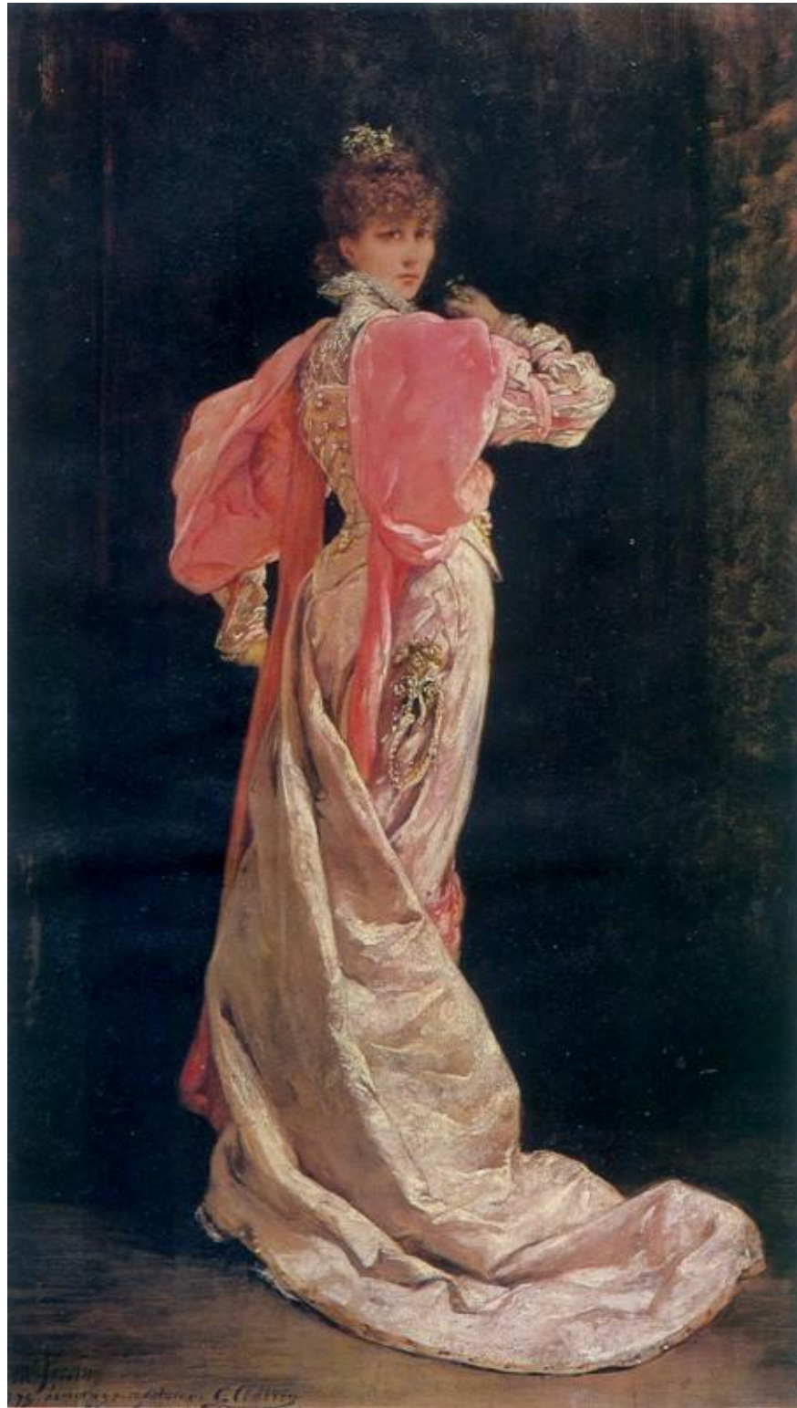
Portrait de Sarah Bernhardt en reine dans Ruy Blas par Georges Clairin, 1876, huile sur toile, Petit Palais, Paris.