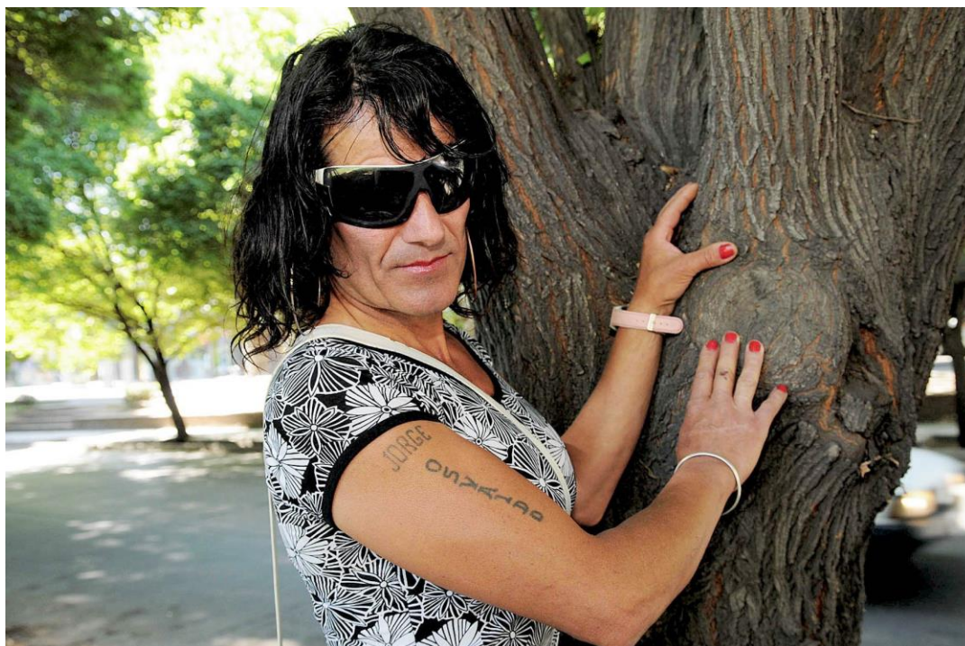
Photographie utilisée sur le site Internet de la chaîne de télévision espagnole Diario 21 pour illustrer des articles sur les travestis.